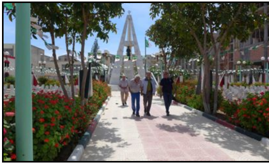
Cimetière mémorial d'Ighzer Amokrane

Ils ajoutent : « Cette histoire, a bouleversé nos vies. Mais – aujourd'hui – retournant en Algérie, c'est une autre page que nous voulons écrire... Solidaire et fraternelle, celle-là ! »