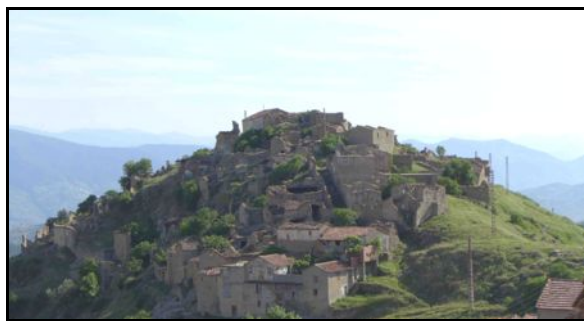
Aghouren, village vidé et bombardé en 1957

On ne peut pas dire que « le pays des droits de l'Homme », se soit très bien comporté, à ce moment-là.