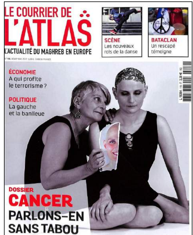
Le Courrier de l'Atlas L'actualité du Maghreb en Europe n° 119, novembre 2017