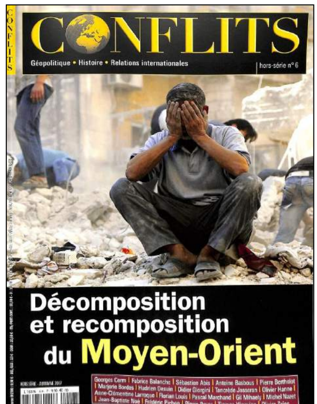
Conflits Hors-Série, automne 2017