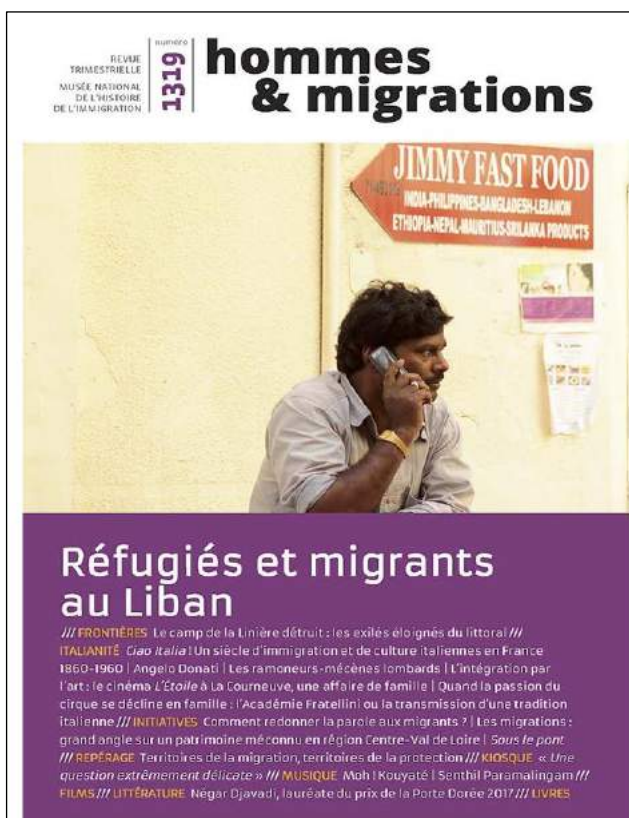
Hommes et migrations n° 1319, automne 2017