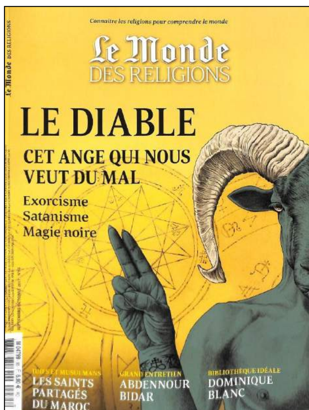
Le Monde des religions n° 86, novembre 2017