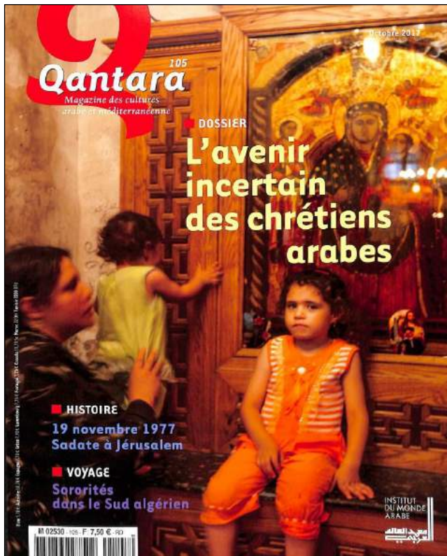
Qantara N° 105, automne 2017