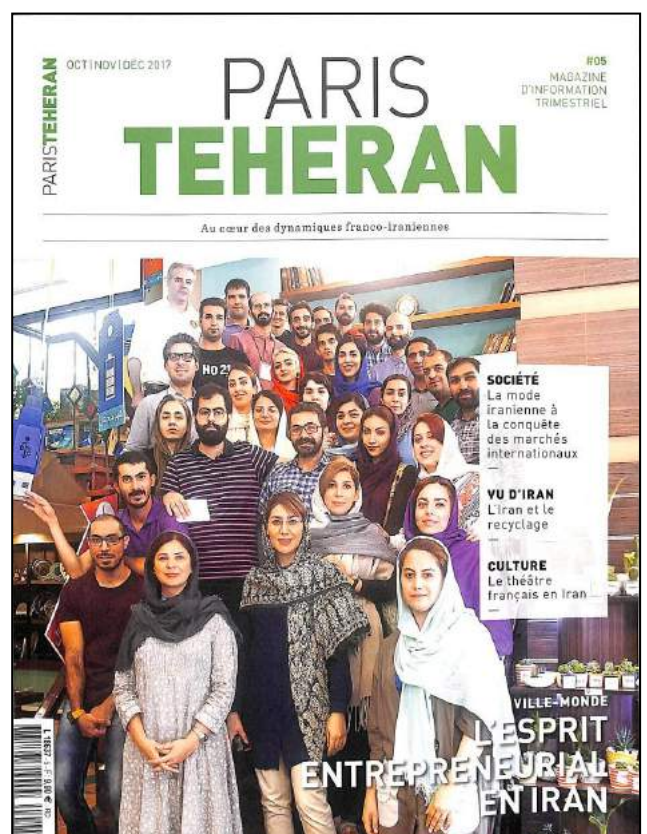
Paris Téhéran n° 5, automne 2017