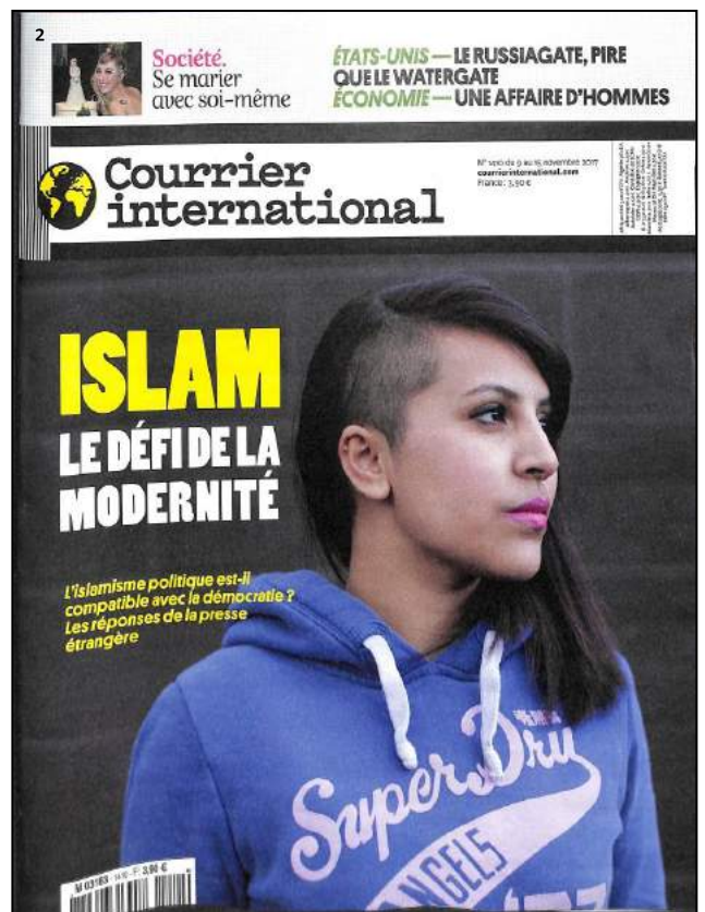
Courrier International N° 1410, 9 novembre 2017