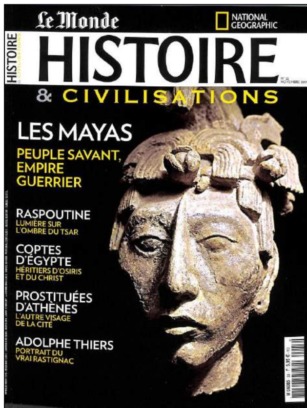
Histoire et Civilisations n° 33, octobre 2017