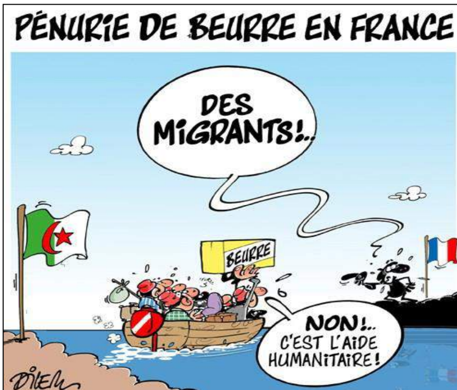
Dilem, dimanche, 5 novembre 2017