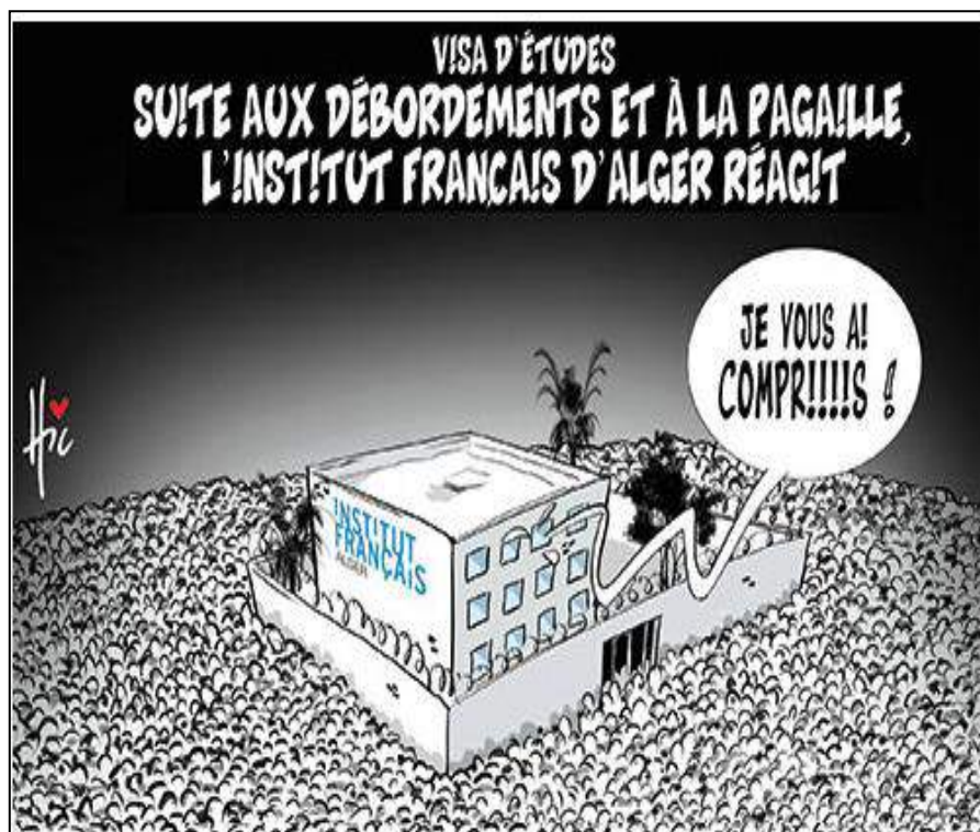
Le hic, mardi, 31 octobre 2017